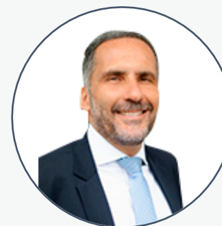
Mário Luiz Sarrubbo PGJ – SP | Presidente GNPP

O grupo também expede manifestações sobre propostas em tramitação no Poder Legislativo e no CNMP, bem como promove intercâmbio constante de informações e de material de apoio, em auxílio às Procuradorias-Gerais e aos órgãos de execução do Ministério Público.